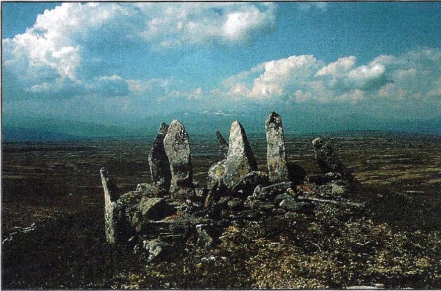
I forgrunnen sees «Sjustenene» med Dovre som ---kgrunn.

setteved til gruvene, røstved til røstingene og trekull til smeltinga. Det var derfor nødvendig å rå over betydelige skogstrekninger. Derfor finner jeg det svært naturlig at soknedalingene og budalingene og folk fra nabobygdene var involvert i de to kobberverkens virksomhet. Her var det behov for arbeidskraft både i gruvene og ved smelthytene og ikke minst til all transporten av trevirke og kull som måtte til for å holde produksjonen i gang. Dette førte helt sikkert til større ferdsel langsmed veien over Farmannsfjellet. Mye av denne transporten egnet seg sikkert best om vinteren. De tunge lassa krevde en sledevei som fulgte elver og vann. Om de fulgte sjølve ruta over Farmannsfjellet vites ikke, men at Stavilldalsområdet ble benyttet som det mest naturlige veivalget for å nå smelthytta i Nåvårdalen, kobberverket på Kvikne og Budalens Kobberverk, finner jeg høyst rimelig.